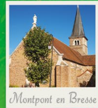
Montpont en Bresse

Avant de s'appeler Montpont en Bresse en 1961, la commune s'est tout d'abord nommée « Mons Pavonis » puis « Montpaon ». Ce qui explique le paon sur son blason.